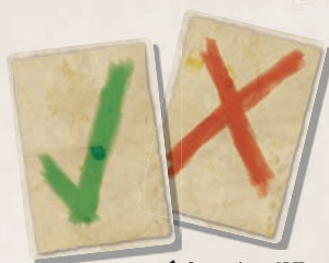
1 karta ANO 1 karta NE