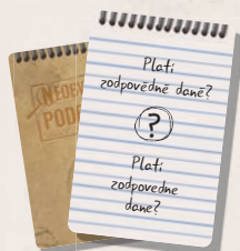
110 karet s otázkami