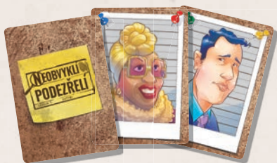
70 karet podezřelých