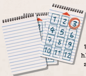
12 karet hledaného zločince