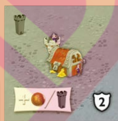
Šedou stranou vzhůru leží žeton na plánu

Na konci hry se města obsahující korunku bodují dle stejných pravidel jako oblasti všech ostatních typů, tedy počet políček krát počet korunek v daném městě.