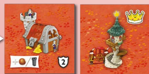
Takto se žetony budov pokládají do království.

Královna: Je-li ve vašem království královna, snižují se pro vás všechny stavební náklady o 1 minci (nemohou však klesnout pod nulu). Pokud královnu máte na konci hry, můžete ji postavit do své nejrozlehlejší oblasti libovolného typu (tedy oblasti o nejvyšším počtu políček). Při bodování oblasti se pak královna počítá jako jedna korunka navíc.