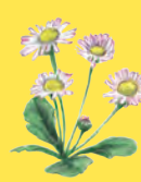
s listovou růžicí