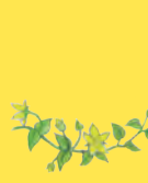
poléhavý nebo plazivý