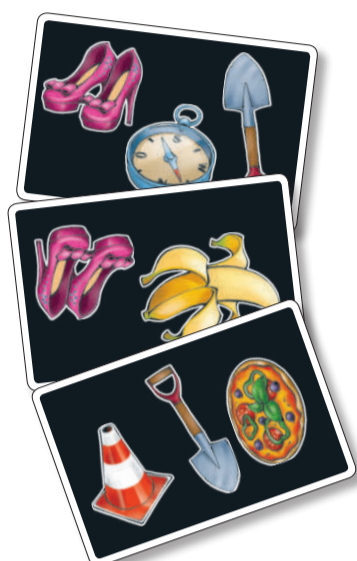
36 hracích karet